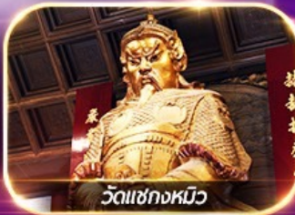
วัดเชกวงหมิว