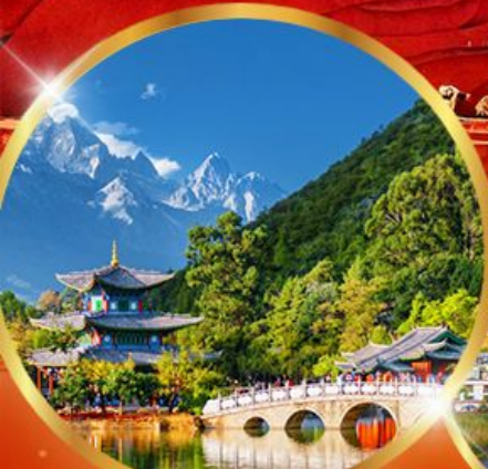
สระมิงกรี่ล่า