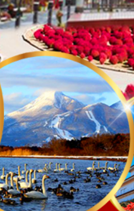
ทะเลสาบอินาวะชิโระ