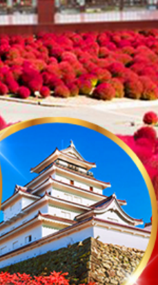
ปราสาทสิรุกะ