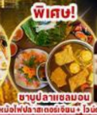
ชาบูปลาลาเชลมอน หม้อไฟปลาสดอร่อยชิ้น+ ไรต์ดราลด์