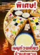
เมนูถ้วยเต๋อชิว ยำสะพาน