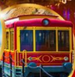
รถรางซาปา