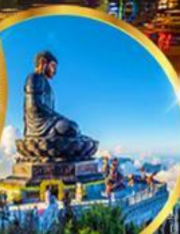
ฟานซีปัน