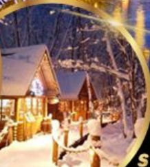
หมู่บ้านเทพนิยาย นิงเกิลเทอร์ส