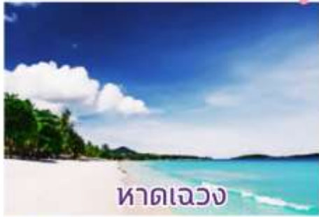
หาดเจว่ง