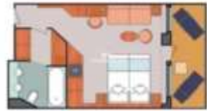
Floor Diagram Suite Sleeps up to: 3 42 Cabins Cabin: 337 sqft (32 m 2 ) * Size may vary, see details below.