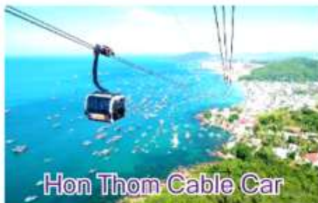
Hon Thom Cable Car