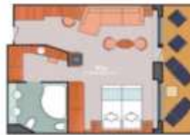
Floor Diagram Grand Suite Sleeps up to 4 10 Cabins Cabin: 456 sqft (43 m 2 ) * Size may vary, see details below.