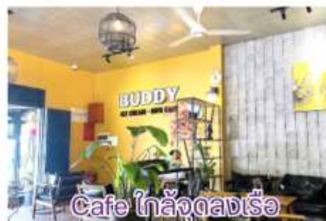
Cafe ใกล้ลงเรือ