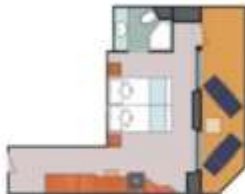
Floor Diagram Mini-Suite Sleeps up to 2 18 Cabins Cabin: 246 sqft (23 m 2 ) * Size may vary, see details below.