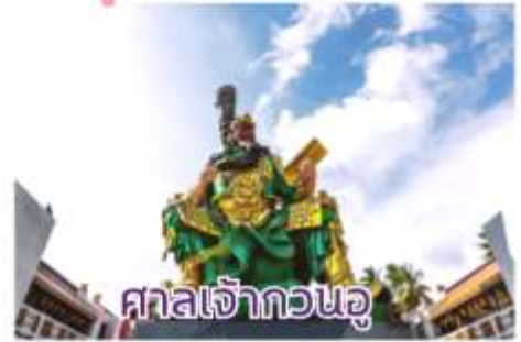
ศาลเจ้ากวนอู