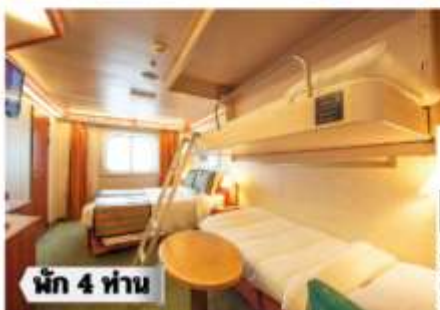
Floor Diagram Oceanview Sleeps up to 4 321 Cabins Cabin: 291 sqft (28 m 2 ) * Size may vary, see details below.

ห้องพรีเมียมจะมี Location ดีกว่า เช่น ชั้นสูงกว่าห้องคลาสสิก และ สามารถ เลือกรอบ อาหารค่ำได้