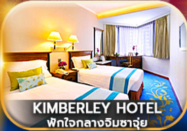
KIMBERLEY HOTEL พักใจกลางจิมซาจุ้ย