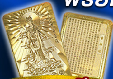
แถมฟรี แผ่นทองเจ้าแม่กวนอิม