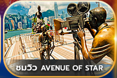
ชมวิว AVENUE OF STAR