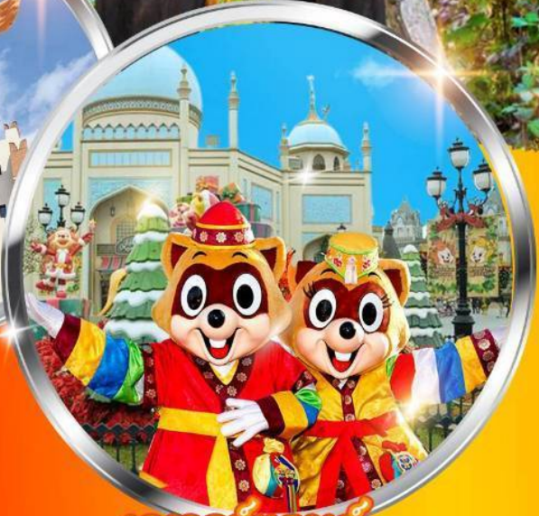
เอเวอร์แลนด์