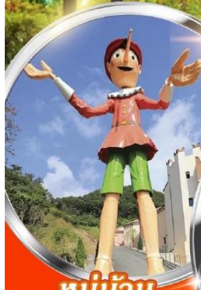
หมู่บ้าน ฝรั่งเศส