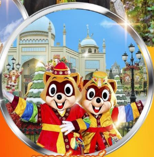
เอเวอร์แลนด์