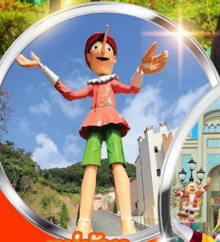
หมู่บ้าน ฝรั่งเศส