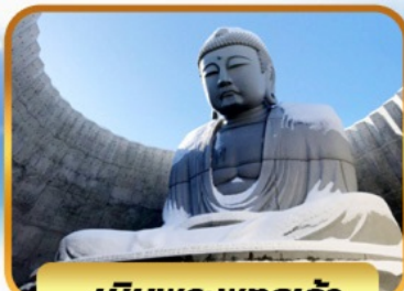
เนินพระพุทธรเจ้า

05-10, 12-17, 19-24 พ.ย. 26 พ.ย. - 01 ธ.ค. 67