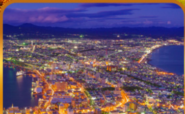
ชมวิวดาโกดาเตะ