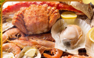
บั้งย่างร้านดังนั้นตะ