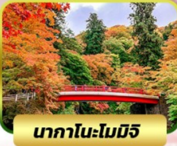
นากาโนะโมมิจิ