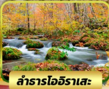
ลำธารโออิราเสะ