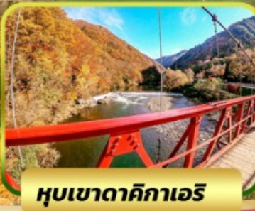
หุบเขาดาคิกาเอริ