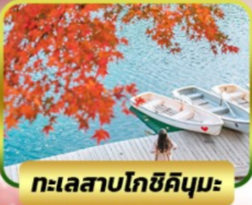
ทะเลสาบโกชิคิคุมะ