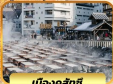
เมืองคุสัทซึ