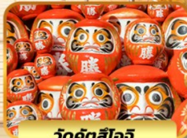
วัดคัตสึโงอิ