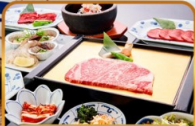
บึงย่างร้านดัง ROKKASEN