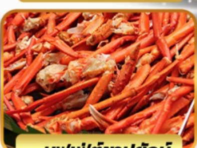
บุฟเฟ่ต์ขาปูยักษ์

ฟรีเดย์โตเกียว 1 วัน อิสระ ช้อปปิ้งหรือช้อปปิ้งที่เซริมิตสึนีย์แลนด์ 27 ธ.ค. - 01 ม.ค. 2568