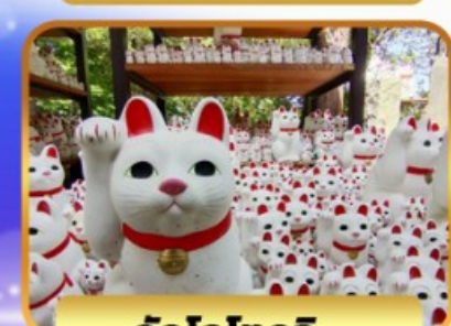
วัดโทโทจิ