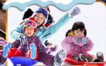
กิจกรรมสกีเล่นหิมะ