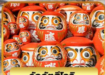
วัดคัตสึโฮจิ