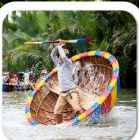
"ล่องเรือกระดิง"

นั่งกระเช้าที่ยาวที่สุดในโลก ขึ้นสู่บาน่าฮิลล์ • หมู่บ้านฝรั่งเศส • สวนสนุก FANTASY PARK LE JARDIN D'AMOUR • สะพานมือสีทอง • วัดหลินจิ้ง • เมืองโบราณฮอยอัน หมู่บ้านกิมถาน • ล่องเรือกระดิง • สะพานมังกร • APEC PARK • ตลาดฮาน