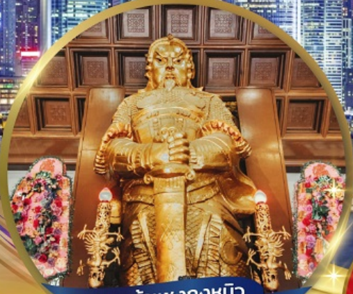
เทพเจ้าเขangkงหมิว (วัดเขangkงหมิว)

จัดเต็มทั้งสายบุญ + สายช้อปปิ้ง ไหว้พระเสริมดวง หมุนกังหันนำโชค วัดเขangkงหมิว นมัสการเจ้าแม่กวนอิมสองสำ • ขอบุ้วัดหวงต้าเซียน • ไหว้พระใหญ่ไ้่วหลิน ช้อปปิ้งย่านจิมซาจุ่ย • ซีตี้เทก เอาท์เล็ต • ถนน LADY MARKET • วิกตอเรียพีค