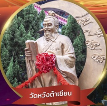
วัดหวงต้าเซียน