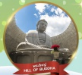
พระใหญ่ HILL OF BUDDHA