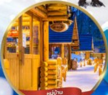
หมู่บ้าน NINGLE TERRACE

สนุกสนาน ณ ลานสกี • หมู่บ้านราเมนอาซาฮิคาว่า • หมู่บ้านนิงเกิลเทอเรส ขบวนพาเหรดเพนกวิน ณ สวนสัตว์อาซาฮิคาว่า • โรงงานช็อกโกแลต โอดารุ • ศาลเจ้าฮอกไกโด • พระใหญ่ HILL OF BUDDHA