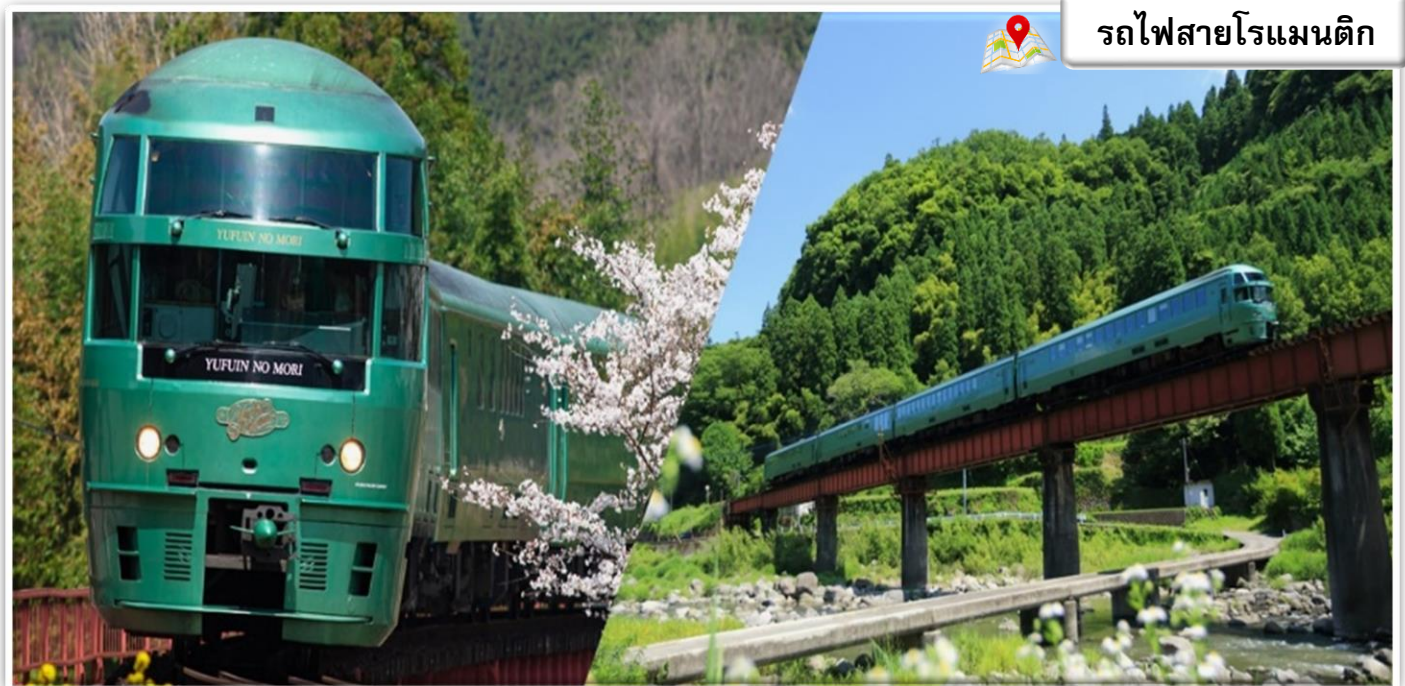
รถไฟสายโรแมนติก