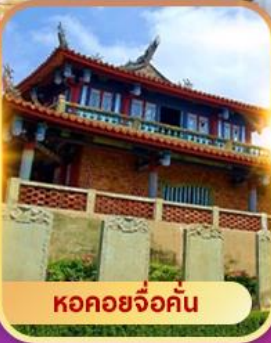
หอคอยจ้อคั่น