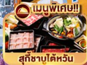
เมนูพิเศษ!!