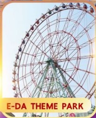
E-DA THEME PARK