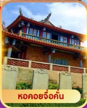
หอคอยจ้อคั่น