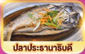
ปลาประจานาธิบดี