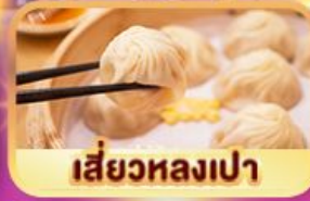
เสี่ยวหลงเปา