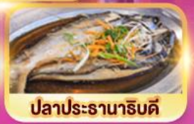
ปลาประธาราธิบดี