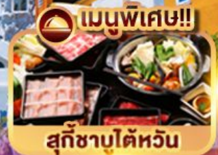
เมนูพิเศษ!! สุกีชาบูได้หวัน