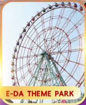
E-DA THEME PARK