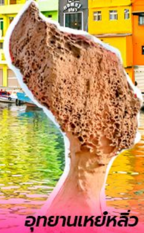
อุทยานเหย์หลิว