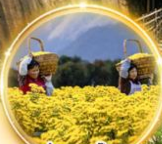
ชมทุ่งดอกไม้ที่สวยงาม สีเหลืองสดใส