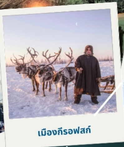
เมืองก็รอฟสค์