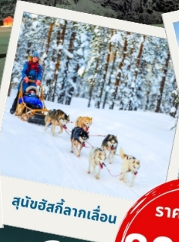
สุนัขฮัสกี้ลากเลื่อน