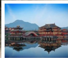
หึงเตี้ยน

ศูนย์ค้าส่งเมืองอี้อู / Hengdian World Studio / พระราชวังหมิงซิง พระราชวังจำลองจินชื้องเต่ / โรงภาพยนตร์ชิงหมิงช่างเหอญู ถนนคนเดินกวางโจวและฮ่องกง / อุทยานสรวงสวรรค์สี่นเสวียจิว สะพานหฺรูอี้ / สะพานมังกร / ล่องเรือทะเลสาบซีหู / ห้าง INN77 ถนนโบราณเหอฝ่งเจีย / สะพานงเงิน / ถนนโบราณเสี่ยวเหอ