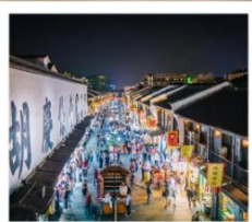
ถนนโบราณเหอฝ่งเจีย