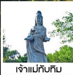
เจ้าแม่ทับทิม