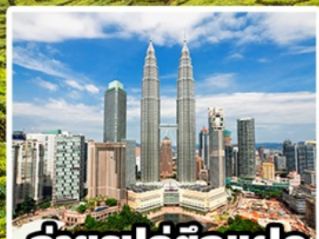
ถ่ายรูปคู่ตึกแฝด