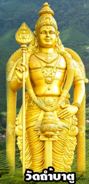
วัดถ้ำบาตุ

ปุตรจายา-คาเมรอน-เก็นตัง-กัวลาฯ 3วัน2 คืน โดยสายการบิน มาเลเซีย แอร์ไลน์ (MH)