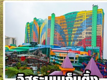
อิสระบนเก็นตัง