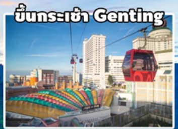
ขึ้นกระเช้า Genting

คาเมร่อน - เก็นติ้ง - มะละกา-กัวลาฯ 4วัน3คืน โดยสายการบิน มาเลเซีย แอร์ไลน์ (MH)