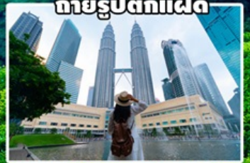
ถ่ายรูปตึกแฝด