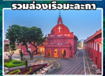
รวมล่องเรือมะละกา