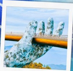
บาน่าฮิลล์