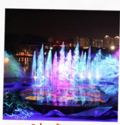
โชว์ม่านน้ำสามมิติ OCT BAY WATER SHOW