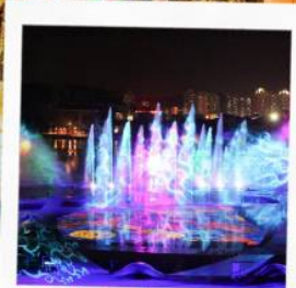
โชว์น้ำสามมิติ OCT BAY WATER SHOW