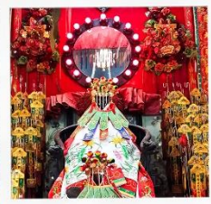
เจ้าแม่กวนอิมสองฮ่า