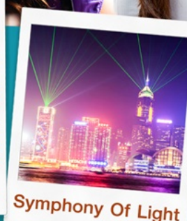
Symphony Of Light