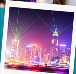
Symphony Of Light