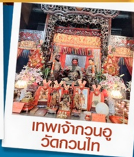
เทพเจ้ากวนอู วัดกวนไท่