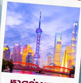
ทิวทัศน์