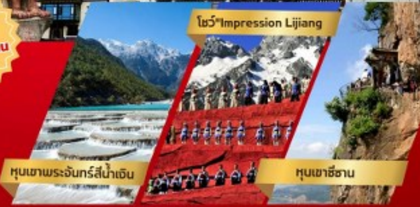
หุบเขาพระจันทร์สีน้ำเงิน