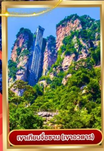
เขาเทียนจื่อซาน (เขาวงกต)