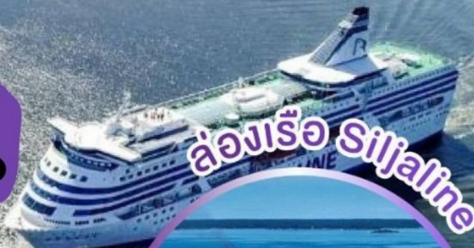
ล่องเรือ Siljeline