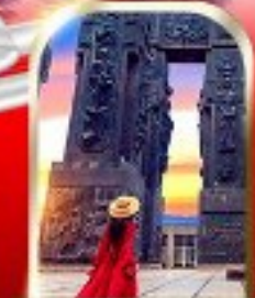
THE CHRONICLE OF GEORGIA