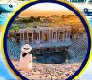
นครเอเฟซโบราณ