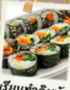
เรียนทำคิมบัม