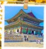
วังเคียงบกทง