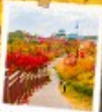
นัมซานพาร์ค