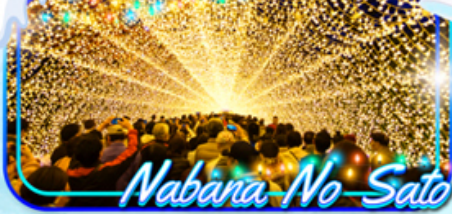
Nabana No Sato