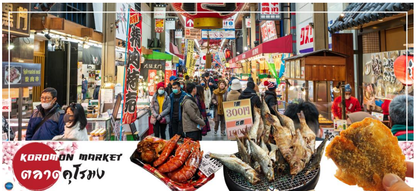
KUROMON MARKET ตลาดคุโรมง

จากนั้นนำท่านเดินทางสู่ ตลาดคุโรมง โอซาก้า (Kuromon Ichiba Market) เป็นตลาดที่มีชื่อเสียงและเก่าแก่ที่สุดแห่งหนึ่งของเมืองโอซาก้า บรรยากาศภายในเป็นทางเดิน Arcade เล็กๆ ทอดยาวประมาณ 600 เมตร 2 ข้างทางจะเต็มไปด้วยร้านค้าต่างๆกว่า 160 ร้านค้าขายทั้งของสด และแบบพร้อมทาน มีของกินเล่นและอาหารพื้นเมืองมากมายหลายชนิดให้ได้ชิมกัน