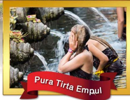
Pura Tirta Empul