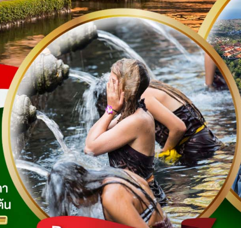
Pura Tirta Empul