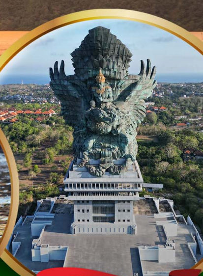
สวนวิษณุ