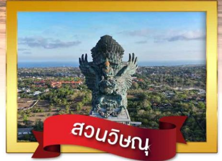
สวนวิษณุ