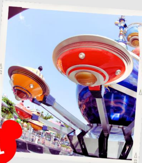
MAIN STREET USA