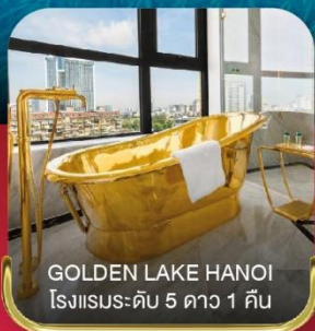
GOLDEN LAKE HANOI โรงแรมระดับ 5 ดาว 1 คืน