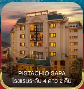
PISTACHIO SAPA โรงแรมระดับ 4 ดาว 2 คืน