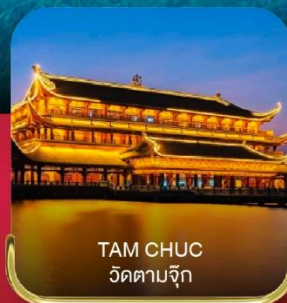
TAM CHUC วัดตามจึก