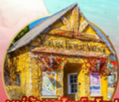
หมู่บ้านสไตลียุโรป! Yufuin Floral Village