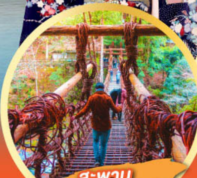
สะพาน อียะโนคะชิระบะชิ