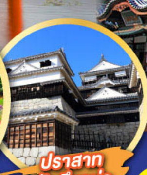
ปราสาท มัตสึยาม่า