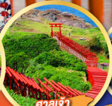
ศาลเจ้า ไมโตโนะซุมิ อินาริ