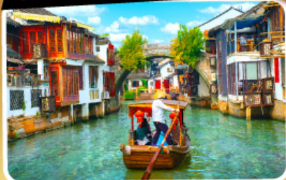
เมืองโบราณจูเจียเจียว