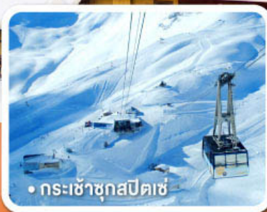
กระเช้าชุกสปีตเซ