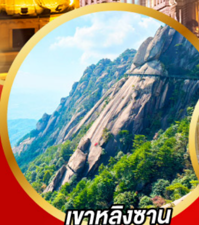
เขาลังซาน