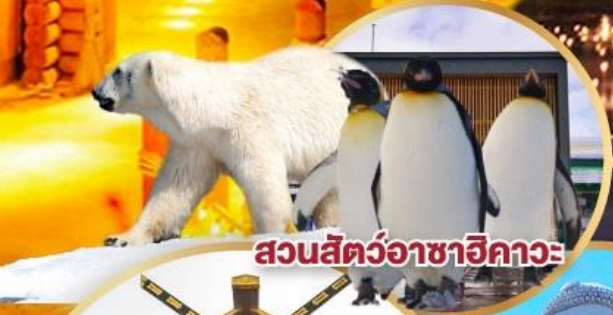
สวนสัตว์อาซาฮิกาวะ