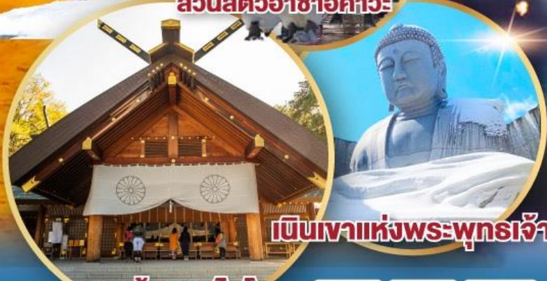
เป็นเขาแห่งพระพุทธรเจ้า