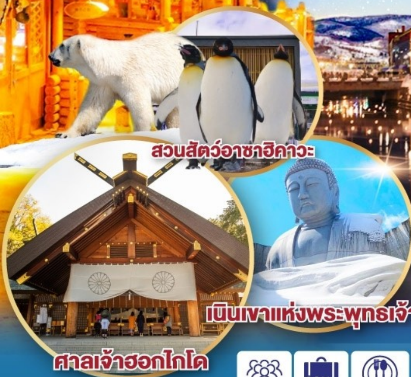
สวนสัตว์อาซาฮิกาวะ